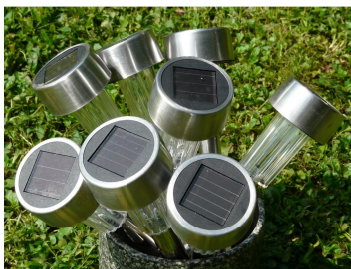
Abbildung 1: Solarzellen im Garten

Dolor sit amet, consetetur sadipscing elitr, sed diam nonumy eirmod tempor invidunt ut labore et dolore magna aliquyam erat, sed diam voluptua. At vero eos et accusam et justo duo dolores et ea rebum. Stet clita kasd gubergren, no sea takimata sanctus est Lorem ipsum dolor sit amet. Lorem ipsum dolor sit amet, consetetur sadipscing elitr, sed diam nonumy eirmod tempor invidunt ut labore et dolore magna aliquyam erat, sed diam voluptua. At vero eos et accusam et justo duo dolores et ea rebum. Stet clita kasd gubergren, no sea takimata sanctus est Lorem ipsum dolor sit amet.