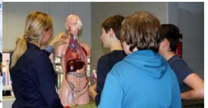
2. Berufsinformationmesse im Schulzentrum am Heimgarten.