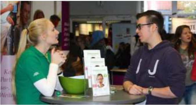
2. Berufsinformationmesse im Schulzentrum am Heimgarten.