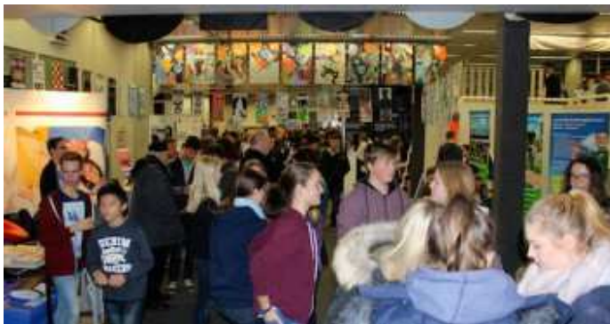
2. Berufsinformationsmesse im Schulzentrum am Heimgarten.