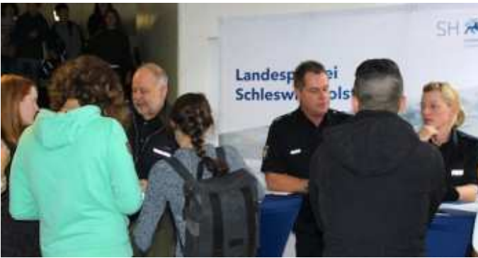
2. Berufsinformationmesse im Schulzentrum am Heimgarten.