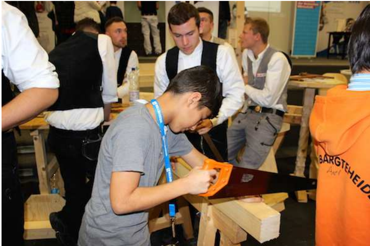
2. Berufsinformationssmesse im Schulzentrum am Heimgarten. Auf der Aktionsfläche der Handwerkskammer.

Ahrensburg (ve). Es war erst die zweite Berufsinformationssmesse, doch schon jetzt zeichnet sich ab, dass sie ein dauerhafter Erfolg werden könnte.