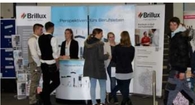
2. Berufsinformationmesse im Schulzentrum am Heimgarten.