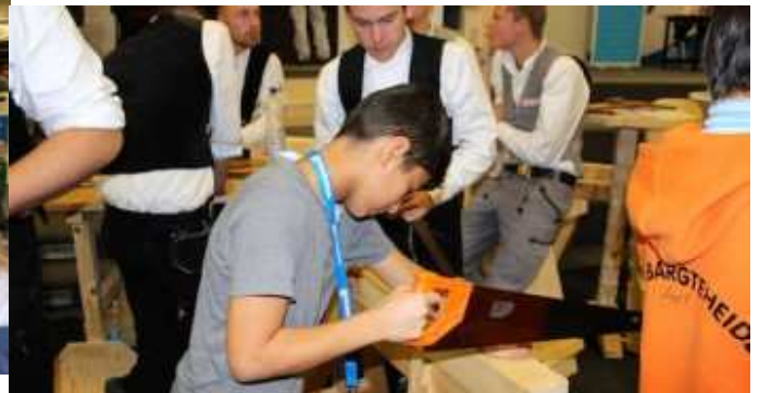
2. Berufsinformationsmesse im Schulzentrum am Heimgarten. Auf der Aktionsfläche der Kreishandwerkerschaft Stormarn.