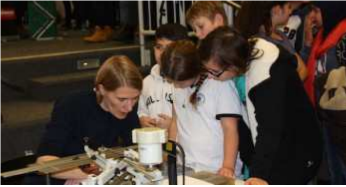
2. Berufsinformationmesse im Schulzentrum am Heimgarten.