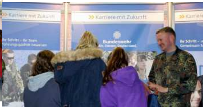
2. Berufsinformationmesse im Schulzentrum am Heimgarten.