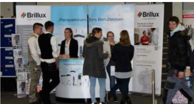
2. Berufsinformationmesse im Schulzentrum am Heimgarten.