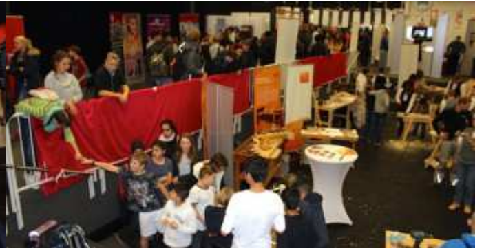
2. Berufsinformationmesse im Schulzentrum am Heimgarten.